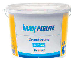
TecTem® Grundierung alapozó