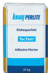
TecTem® Klebespachtel ragasztó