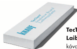
TecTem® Laibungsplatte kávaelem