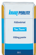
TecTem® Füllmörtel hézagoló