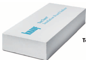
TecTem® Insulation Board Indoor