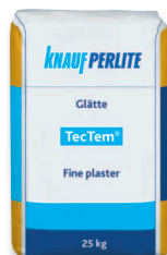
TecTem® Glätte finiselő simító