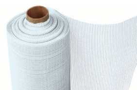
TecTem® Gewebe háló