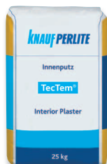
TecTem® Innenputz belső vakolat